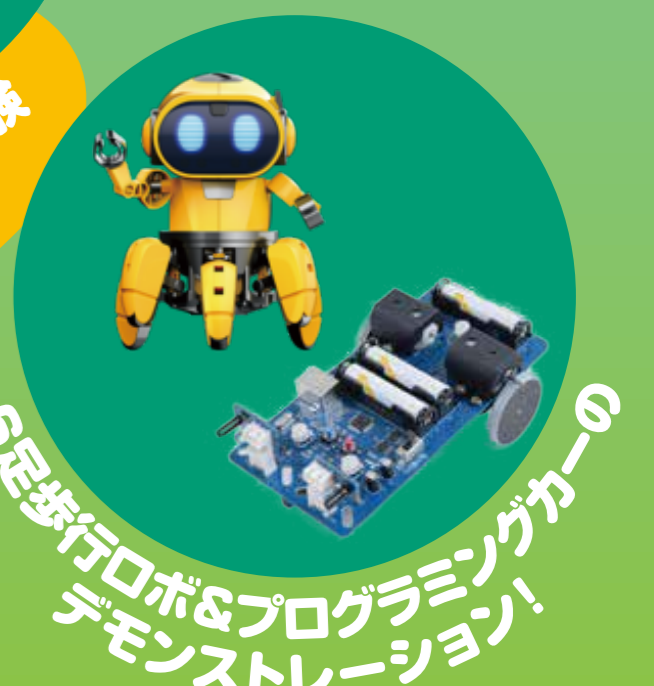
6足歩行ロボとプログラミングカーの デモンストレーション!